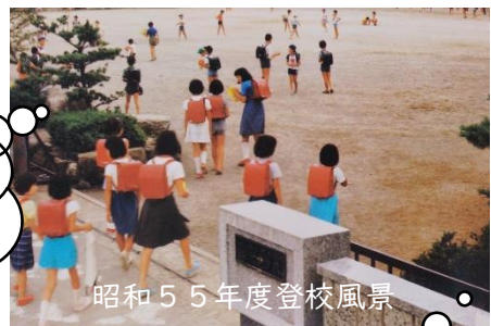
昭和55年度登校風景