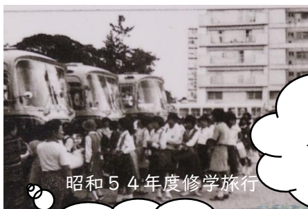
昭和54年度修学旅行

年末、年始、家族で過ごす時間も多と思います。親子で会話する時間を多くとり、親子の絆を更に深めていただきたいと思います。