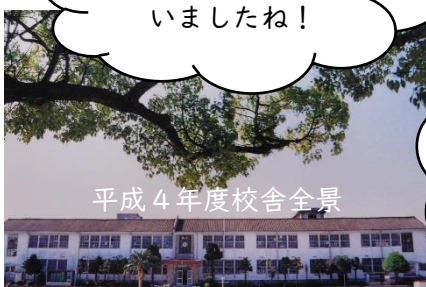
平成4年度校舍全景