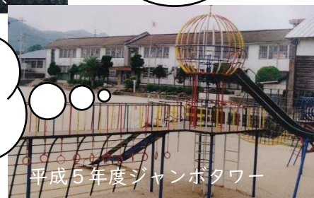
平成5年度ジャンボタワー